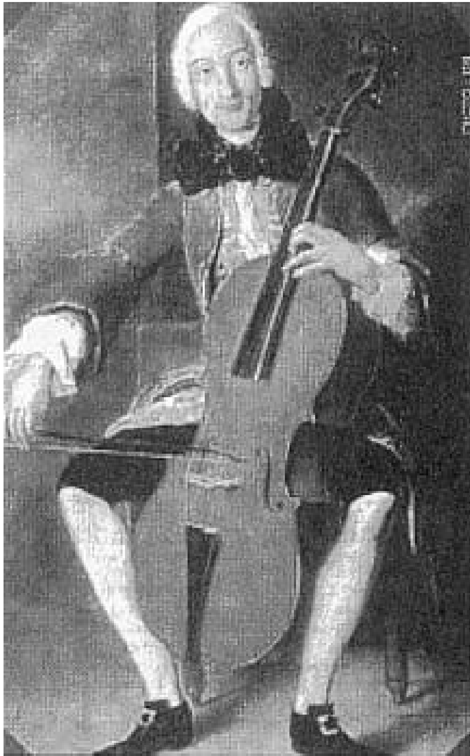
Peinture représentant Luigi Boccherini au violoncelle

Annexe 4 : posture pour la tenue du violoncelle baroque :