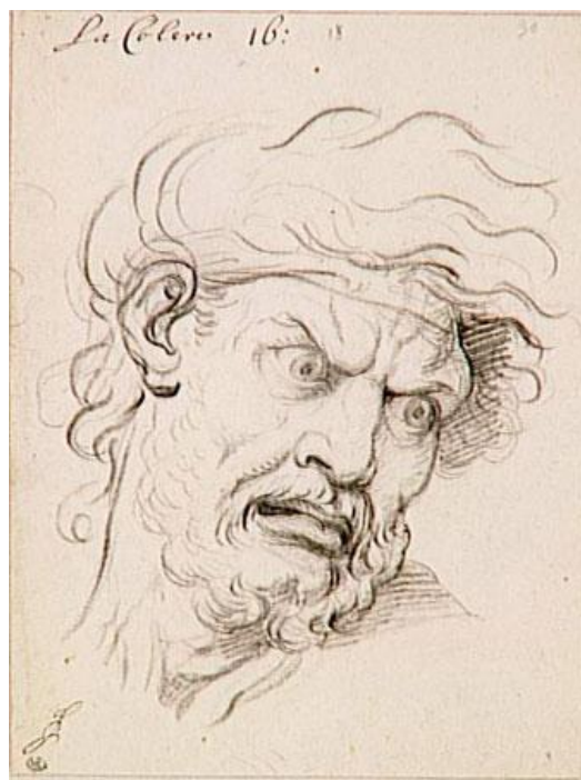
Charles Le Brun : Les Expressions de l'Âme : La Colère.

La théorie des passions s'est également exprimée à travers d'autres arts, notamment au théâtre et comme ici par exemple à travers le dessin :