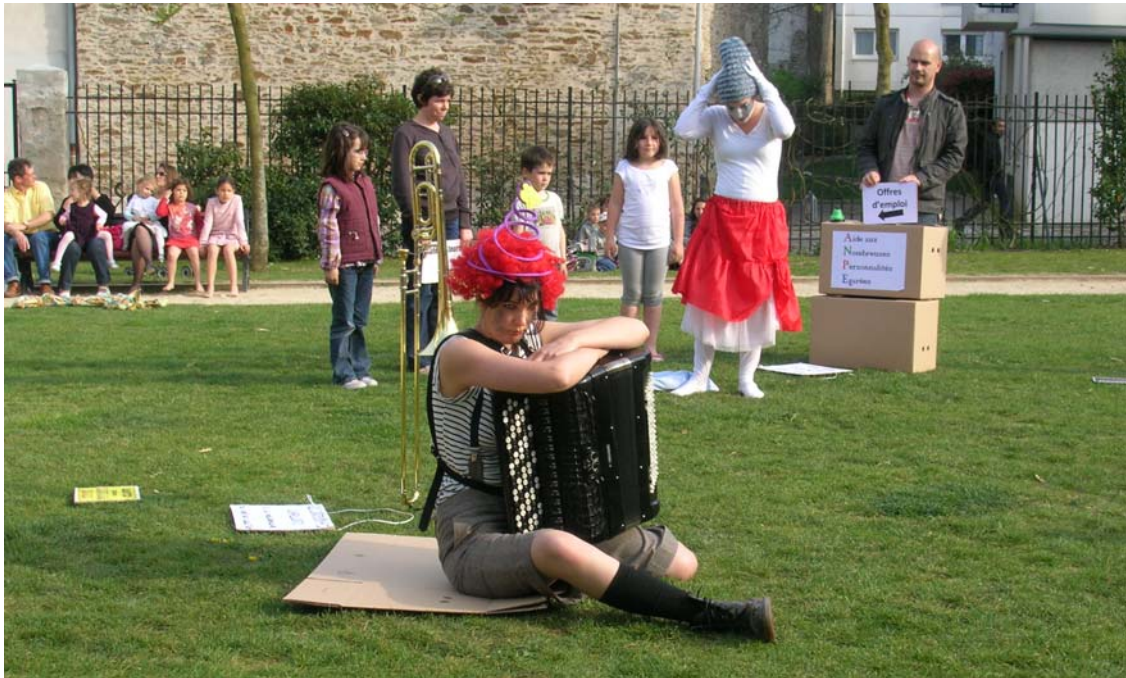
Photo n°3. Entraide entre la danseuse essayant son nouveau rôle d'automate et l'automate essayant son nouveau rôle de danseuse, pendant que les ouvriers de chantier construisent une bouche de métro pour l'accordéoniste :