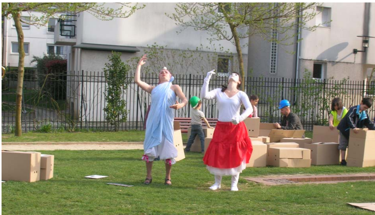
Photo n°4. Le clown a découvert qu'il pouvait encore faire rire et retrouve son identité :